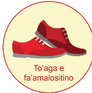
To'aga e fa'amalositino