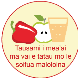
Tausami i mea'ai ma vai e tatau mo le soifua maloloina