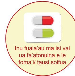
Inu fuala'au ma isi vai ua fa'atonuina e le foma'i/ tausi soifua