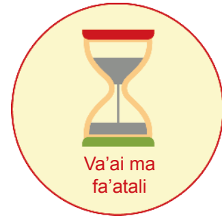
Va'ai ma fa'atali