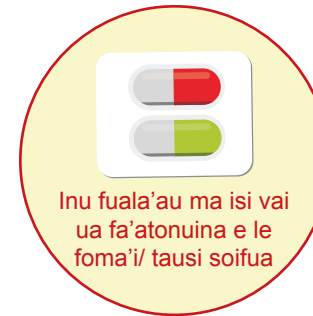
Inu fuala'au ma isi vai ua fa'atonuina e le foma'i/ tausii soifua