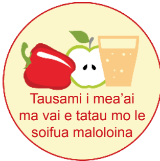
Tausami i mea'ai ma vai e tatau mo le soifua maloloina