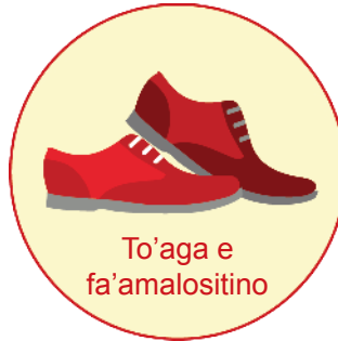
To'aga e fa'amalositino