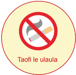
Taofi le ulaula

O vaega ou te fia taumafai e fai ina ia fa'aitiitia le avanoa mo a'afiaga? O a ni fautuaga a la'u tausii soifua?