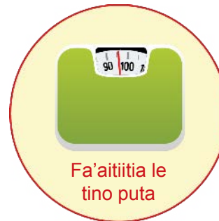
Fa'aitiitia le tino puta